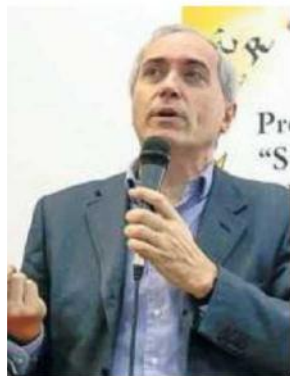
ROBERTO CICALA EDITORE INTERLINEA

Il volume pubblica alcuni suoi scritti e i ricordi raccolti in sua memoria