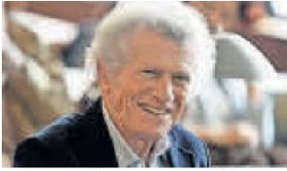
Voce saggia e autorevole.